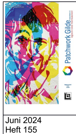
Juni 2024 Heft 155