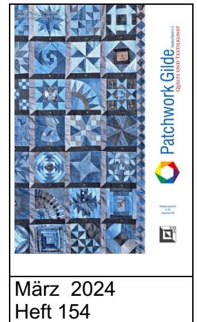
März 2024 Heft 154